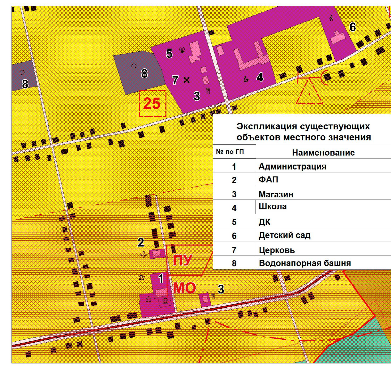
Фрагмент- с.Попово-Лежачи (масштаб 1:5000)